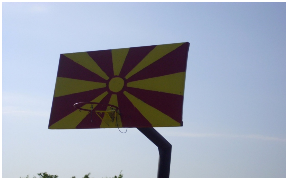
Koš u dvorištu škole u Starom Selu

Po dolasku u oko 8 časova izjutra 28.05.2011. u Staro Selo, živopisno makedonsko seoce severno od Tetova u samom podnožju Ljubotena (tačke A na Google earth mapi), koje leži na 900 mnv. i kraćih priprema, sa usponom smo krenuli oko 8.30 h.