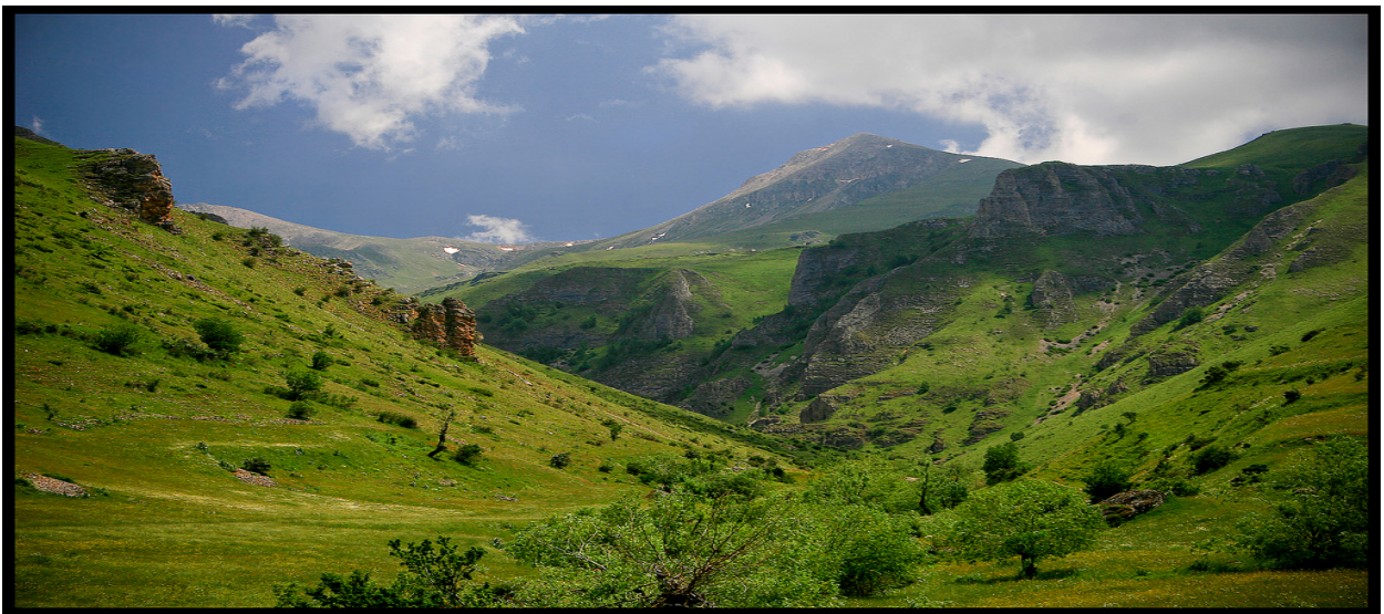
Pogled na Ljuboten sa makedonske strane