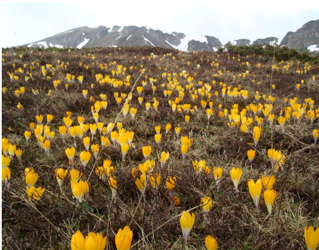
Šarplaninski šafran ( Crocus scardicus )

Nekoliko reči o našoj destinaciji: Šar Planina ime je dobila zbog šarenila pejzaža, zelenih pašnjaka i šuma, palete boja od raznobojnog cveća, prekivenih snegom belih vrhova gotovo čitave godine, plavih “gorskih očiju”- ledničkih jezera koja se nalaze po celom masivu.