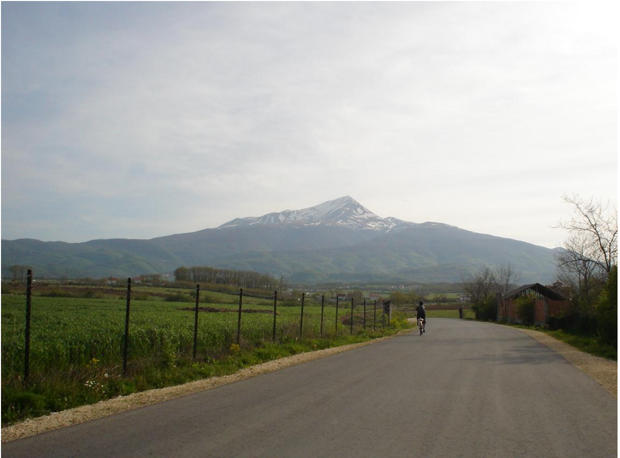
Pogled na Ljuboten sa kosovske strane